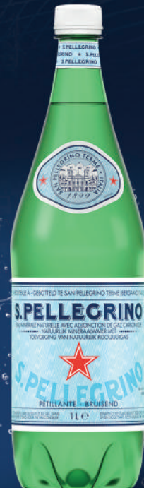
Bouteille 1 L PET Pack de 6