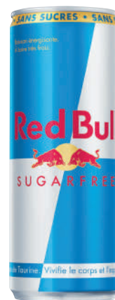
24 x 25 cl