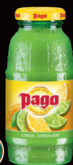
Citron Citron Vert