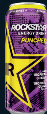
Rockstar Energy Drink Tropical Goyave 50cl