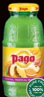
Cocktail Tropical Multivitaminé (1) Sans sucres ajoutés