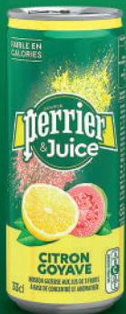
Canette 33 cl Fardeau de 24