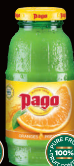
Oranges Pressées (1)(2) Sans sucres ajoutés