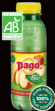
Bio Pommes Pressées (1) Sans sucres ajoutés