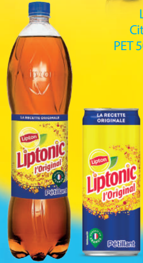
Liptonic Original Sleek Can 33cl /PET 1,5L