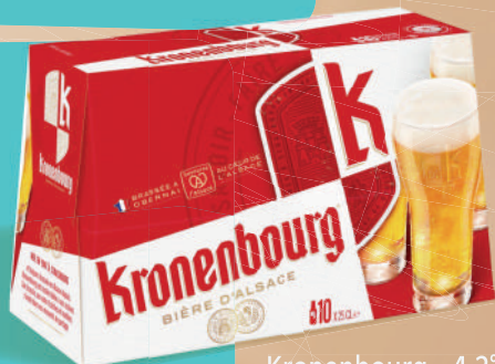
Kronenbourg - 4.2° Pack de 10x25cl

Disponible également en boîtes 33cl et 50cl, packs de 6x25cl et 26x25cl bouteilles, bouteille 6x75cl