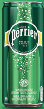
Canette 33 cl Fardeau de 24