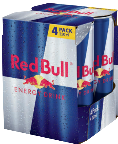
6 x 4 x 25 cl