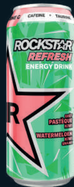
Rockstar Energy Drink Sans Sucres Pastèque Kiwi 50cl