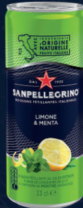
Canette 33 cl Fardeau de 24