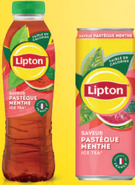
Lipton Ice Tea Pastèque Menthe PET 50cl/Sleek Can 33cl