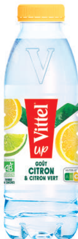
Bouteille 50 cl RPET Fardeau de 24