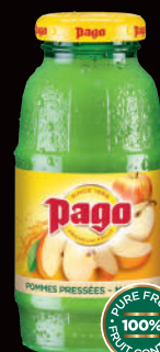
Pommes Pressées (1) Sans sucres ajoutés