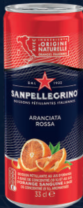
Canette 33 cl Fardeau de 24