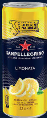
Canette 33 cl Fardeau de 24