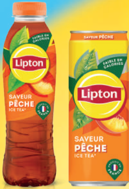
Lipton Ice Tea Pêche PET 50cl/1,25L/1,75L /Sleek Can 33cl