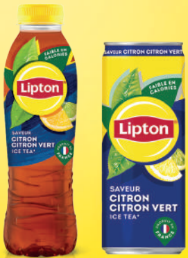
Lipton Ice Tea Citron Citron Vert PET 50cl/Sleek Can 33cl