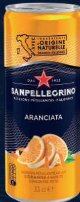
Canette 33 cl Fardeau de 24