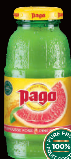
Pampleousse Rose (1) Sans sucres ajoutés