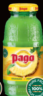
Ananas (1)(2) Sans sucres ajoutés