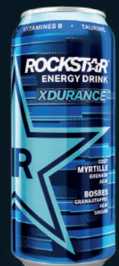
Rockstar Energy Drink Myrtille Grenade 50cl