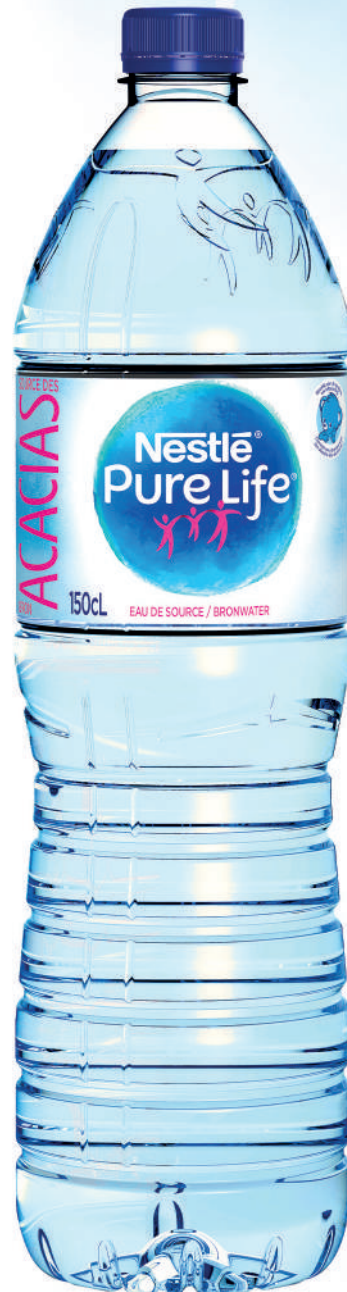
Bouteille 1,5 L PET Pack de 6