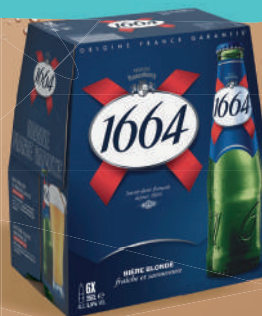
1664 Blonde - 5,5° Pack de 6x25cl bouteilles