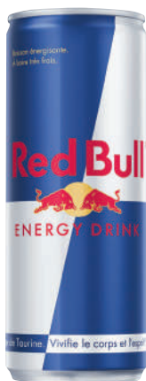
24 x 25 cl