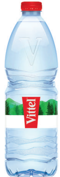
Bouteille 1L RPET Pack de 6