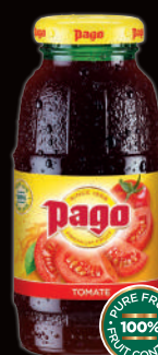
Tomate (1) Sans sucres ajoutés