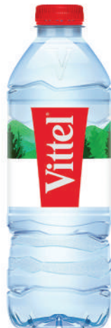
Bouteille ronde 50 cl RPET Fardeau de 24