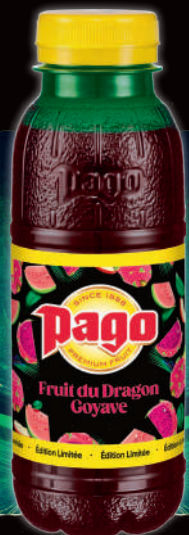
Fruit du dragon