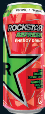
Rockstar Energy Drink Sans Sucres Fraise Citron Vert 50cl