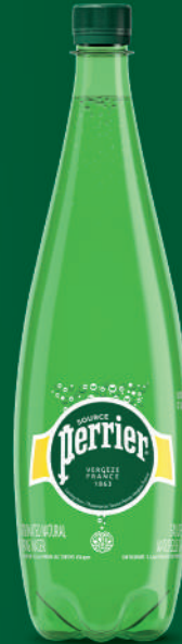
Bouteille 1 L PET Carton de 12