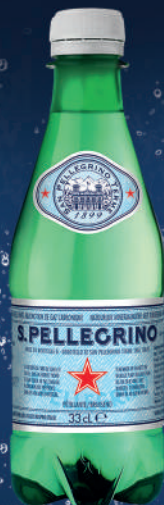
Bouteille 33 cl PET Fardeau de 24