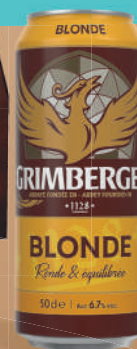
Grimbergen Blonde - 6,7° Fardeau de 24x50cl boîtes

Disponible également en packs de 12x25cl bouteilles