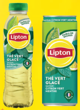
Lipton Ice Tea Thé Vert Saver Citron Vert Menthe PET 50cl/1,25L/Sleek Can 33cl