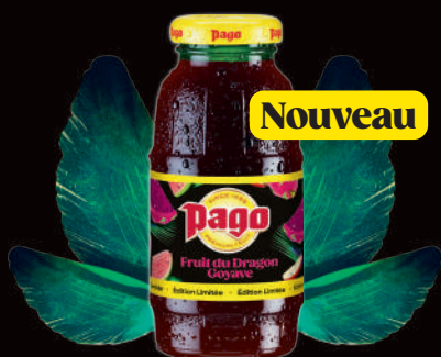
Fruit du dragon