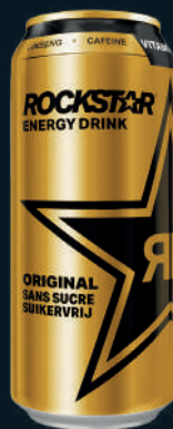
Rockstar Energy Drink Sans Sucres 50cl