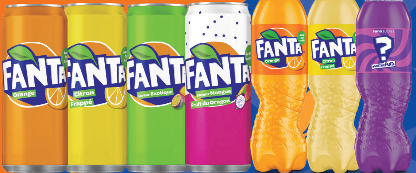
BOITE 33CL SLEEK X24