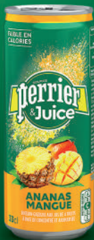
Canette 33 cl Fardeau de 24