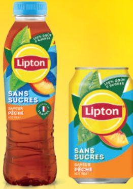
Lipton Ice Tea Sans Sucres PET 50cl/Fat Can 33cl