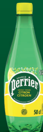
Bouteille 50 cl PET Fardeau de 24

NESTLÉ WATERS MARKETING & DISTRIBUTION SAS 479 463 044 RCS NANTERRE - ISSY-LES-MOULINEAUX - @MARQUE ENREGISTRÉE, UTILISÉE EN ACCORD AVEC LE PROPRIÉTAIRE DE LA MARQUE.