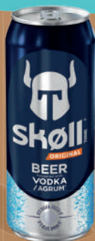
Skoll Original - 6° Fardeau de 12x50cl boîtes