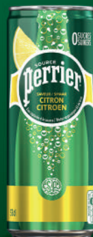
Canette 33 cl Fardeau de 24