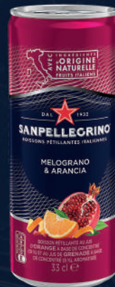
Canette 33 cl Fardeau de 24