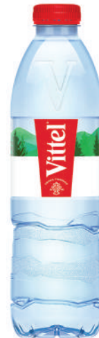
Bouteille 50 cl RPET Fardeau de 24