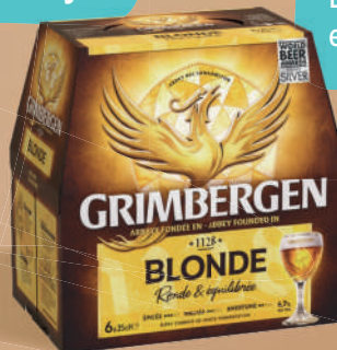
Grimbergen Blonde - 6,7° Pack de 6x25cl bouteilles

Disponible également en packs de 12x25cl bouteilles