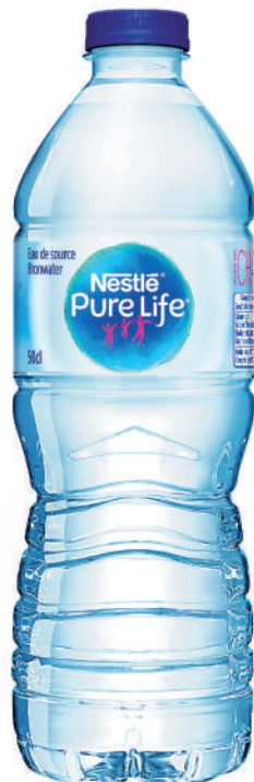
Bouteille 50 cl PET Carton de 24