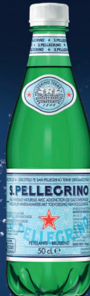
Bouteille 50 cl PET Fardeau de 24