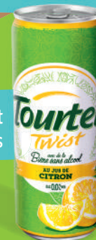
Tourtel Twist Citron - 0,0° Fardeau de 12x33cl boîtes

Disponible également en packs de 6x27,5cl bouteilles