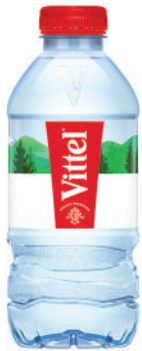
Bouteille 33 cl RPET Fardeau de 24

née dans une nature préservée au cœur des Vosges