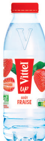
Bouteille 50 cl RPET Fardeau de 24