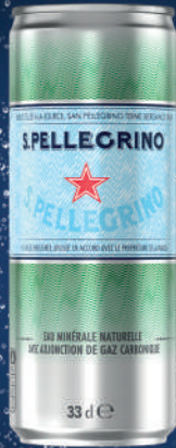
Canette 33 cl Fardeau de 24