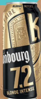
Kronenbourg Blonde Intense - 7,2° Fardeau 6x4x50cl boîtes