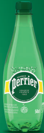
Bouteille 50 cl PET Fardeau de 24