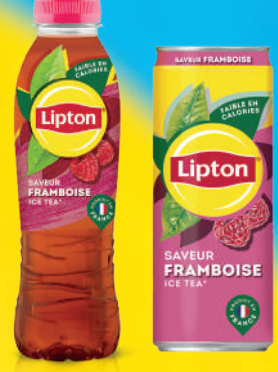
Lipton Ice Tea Framboise PET 50cl/Sleek Can 33cl